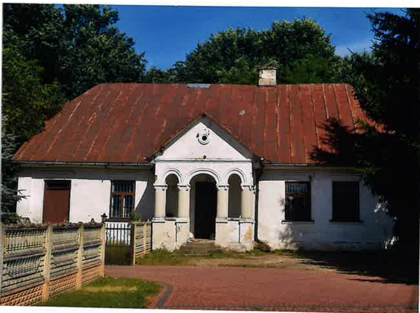
Fot. 1. Elewacja frontowa.