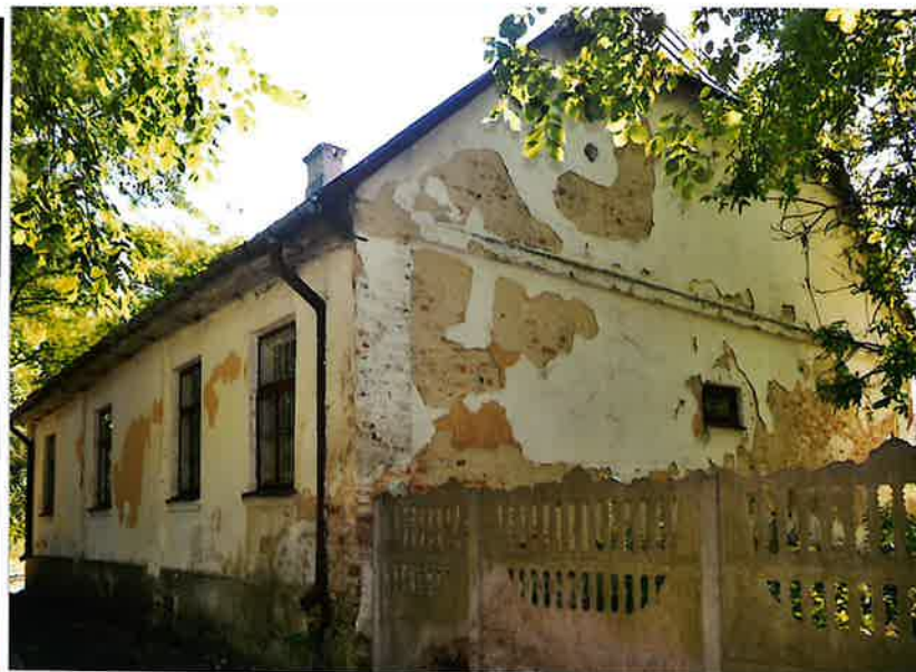
Fot. 2. Elewacja tylna i boczna (zachodnia).